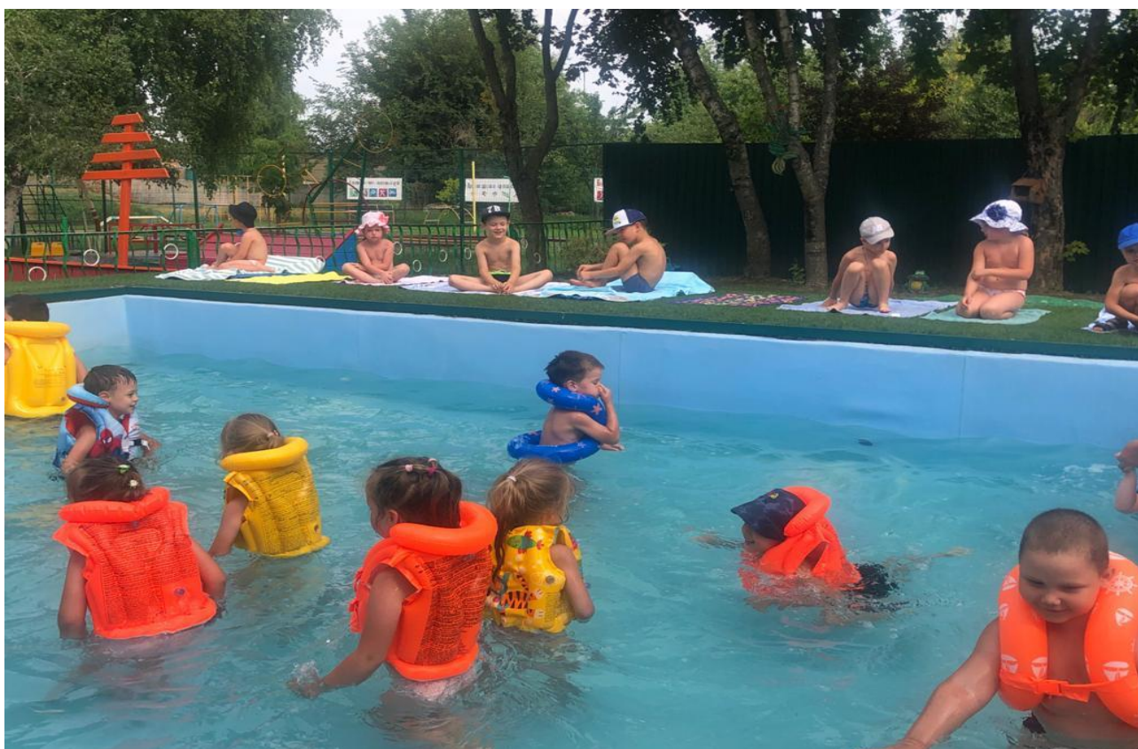
Открытый плавательный бассейн