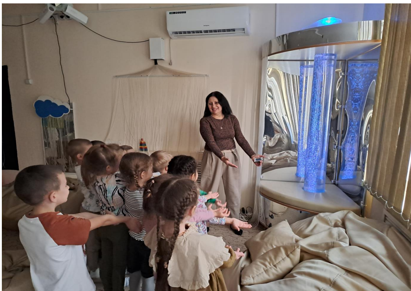
Релаксация «Цветное дыхание»