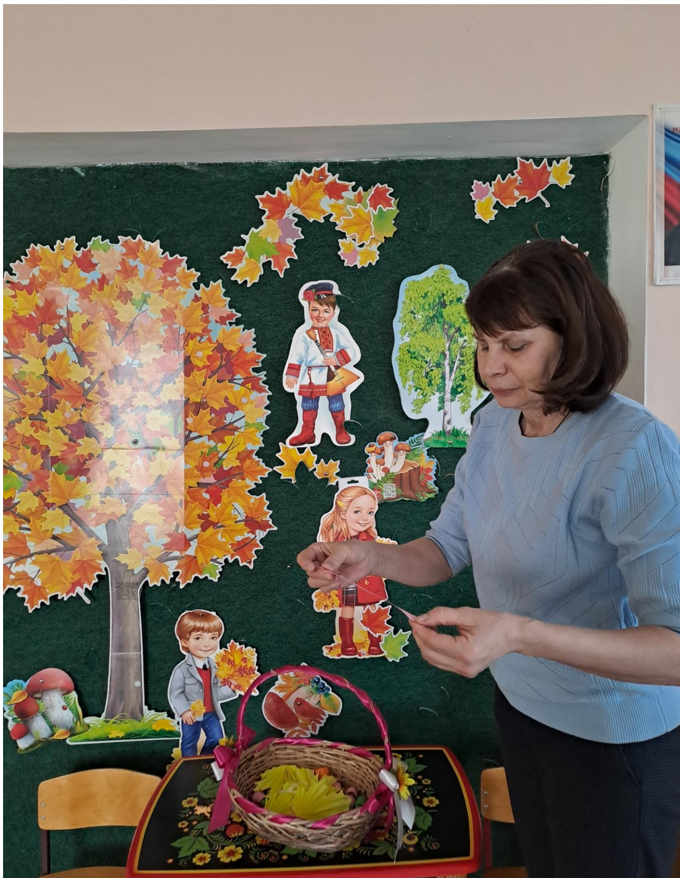
«Осенние предсказания» психологическая акция для сотрудников