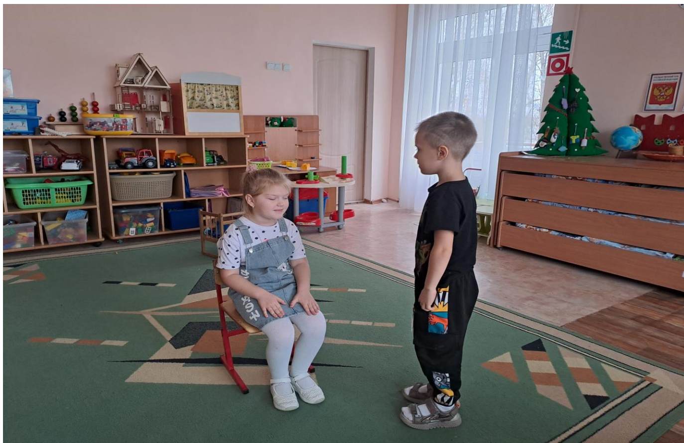
Игровое упражнение «Ласковое слово»