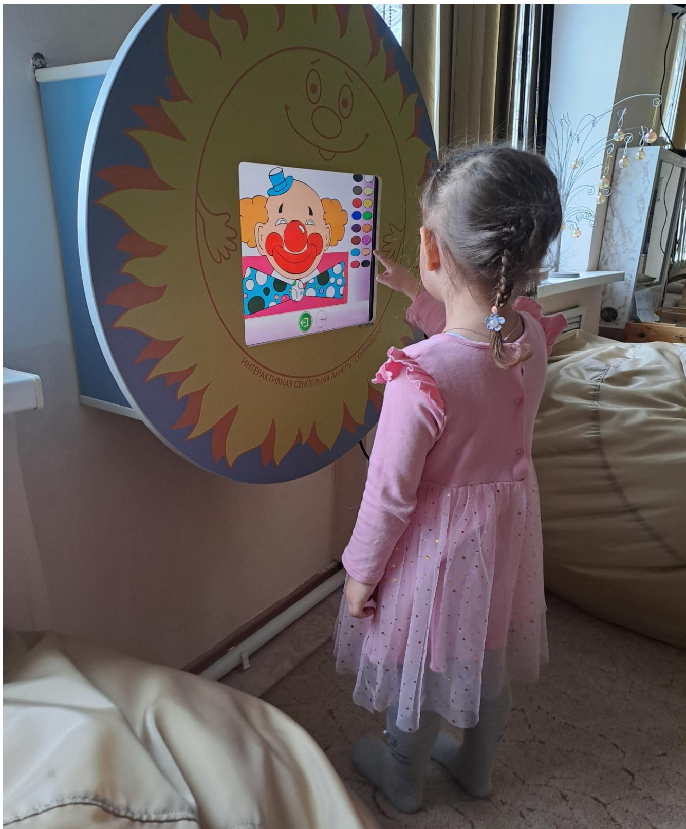
Лекотека с элементами музыкотерапии «Если тебе будет грустно