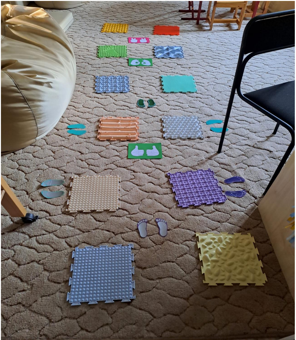
Вход в сенсорную комнату по массажным коврикам в сочетании с кинезиологическими упражнениями