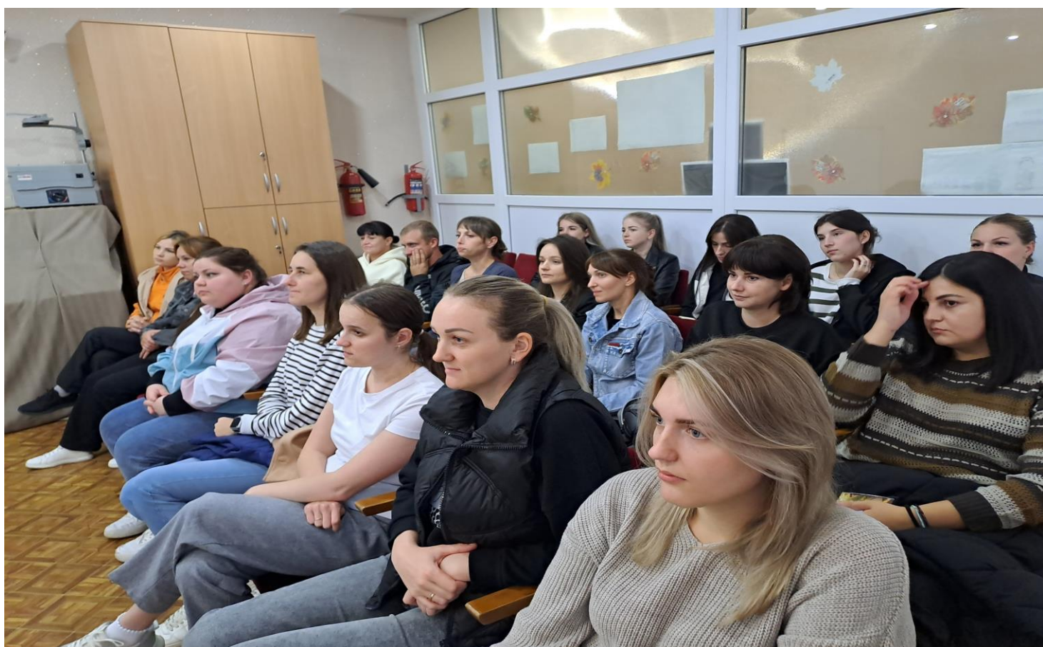
Консультация для родителей « Как справиться с собственными отрицательными эмоциями»