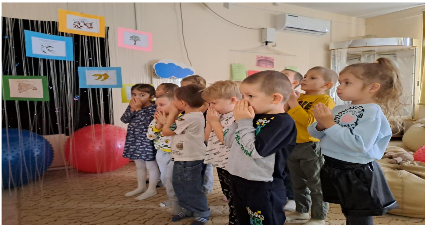
Повторение успокаивающих правил «Когда вы чувствуете себя расстроенными....»