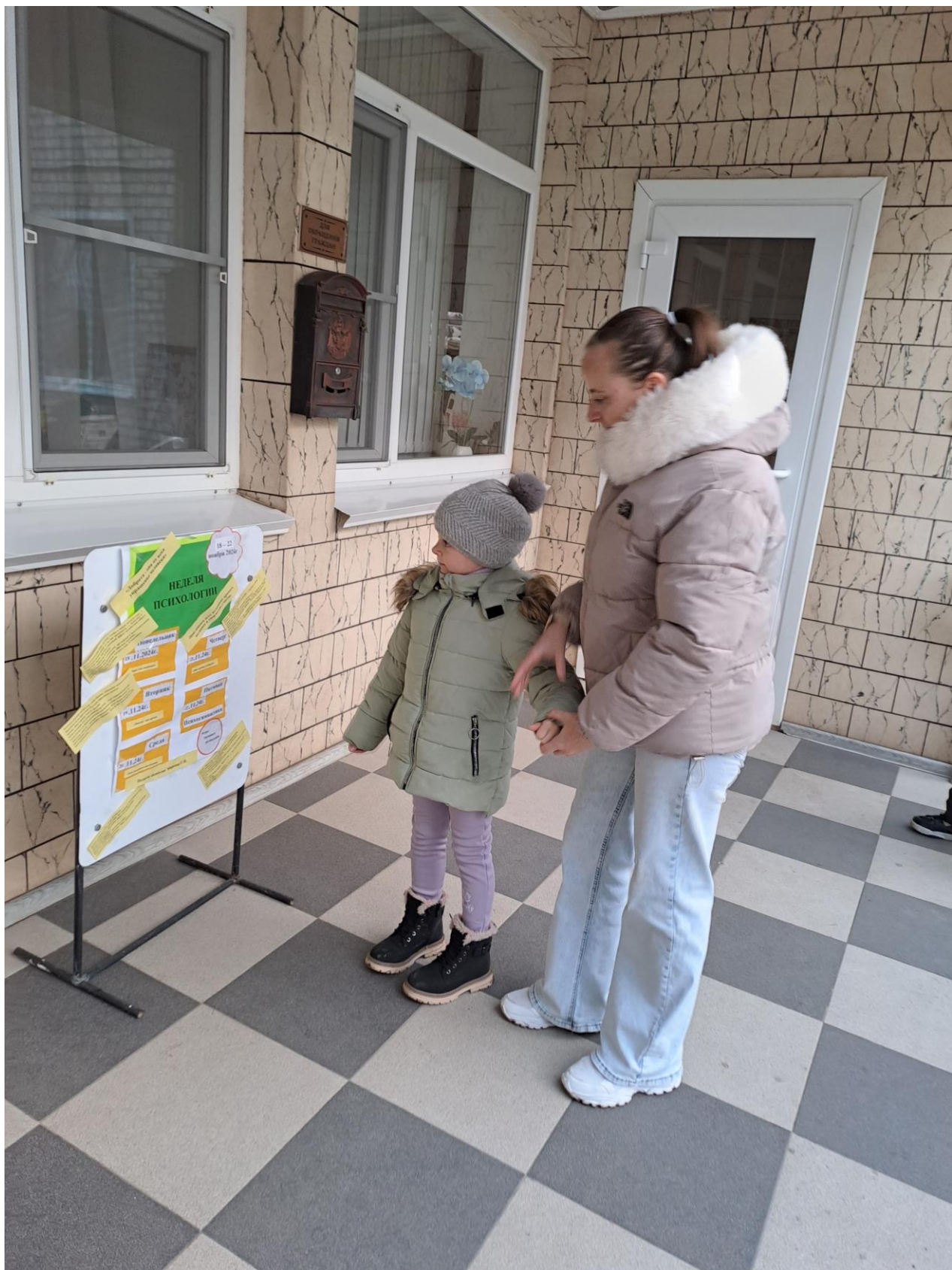
Начало «Недели психологии» с объявления.