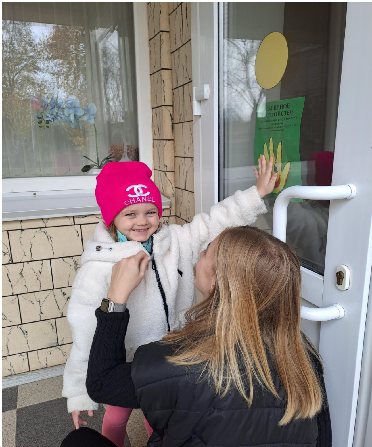
«Ладонка заряджайка» при входе в детский сад