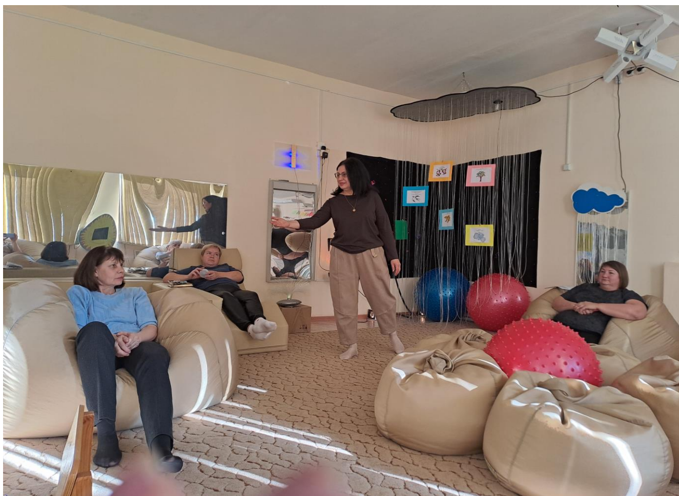
Тренинг для педагогов детского сада «Доброта - она от века украшение человека»