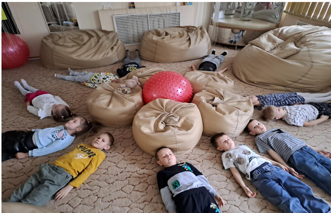
Минутки релаксации «В объятиях бабочки»