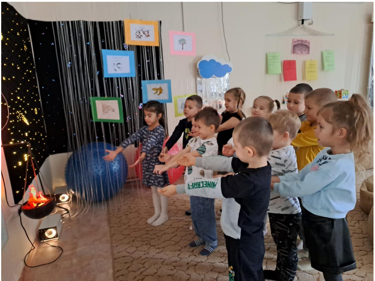
Приветствие у костра на тематической психогимнастике